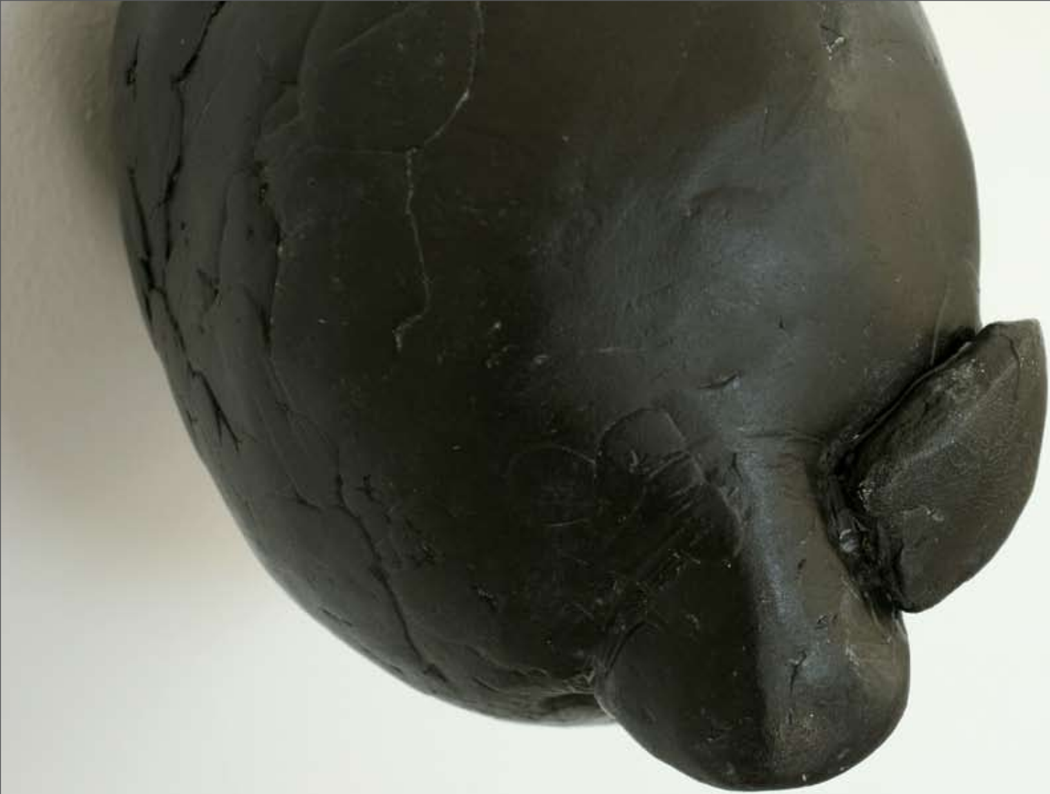
HAJU, 2006, lasikuitu, 20 x 18 x 20 cm