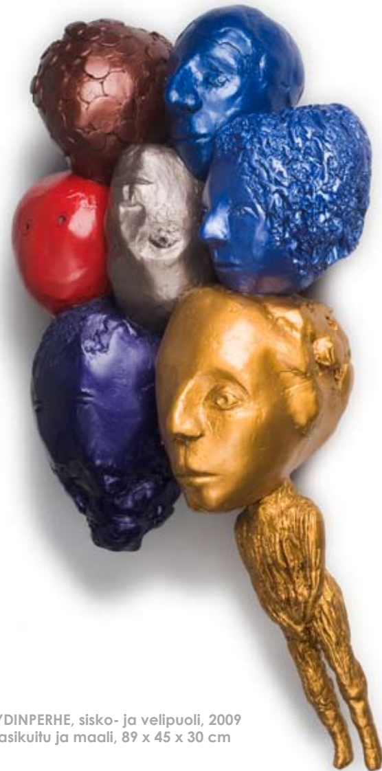
YDINPERHE, sisko- ja velipuoli, 2009 lasikuitu ja maali, 89 x 45 x 30 cm