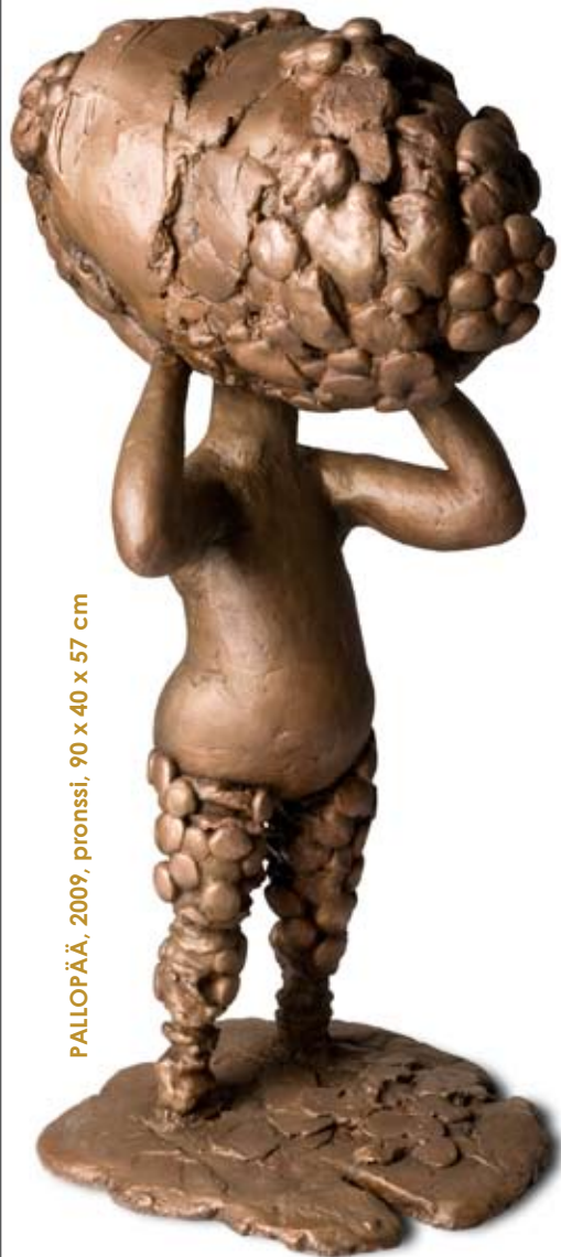
PALLOPÄÄ, 2009, pronssi, 90 x 40 x 57 cm

Laajenevat-teossarjan hahmot ovat androgyynejä alustoja erilaisten tun-nelmien ja psyykkisten varausten esittämiselle. Muodonanto nykyhetken mielettömyydelle ja tehokkuus ajattelun seurauksille on Korhosen veistosten yksi olottuvuus. Hahmojen veistoksellinen ilakointi ja yllättävät perspektiivit saa-vat katseen tarkentumaan itse hahmoihin ja niistä lenteleviin mielikuviin.