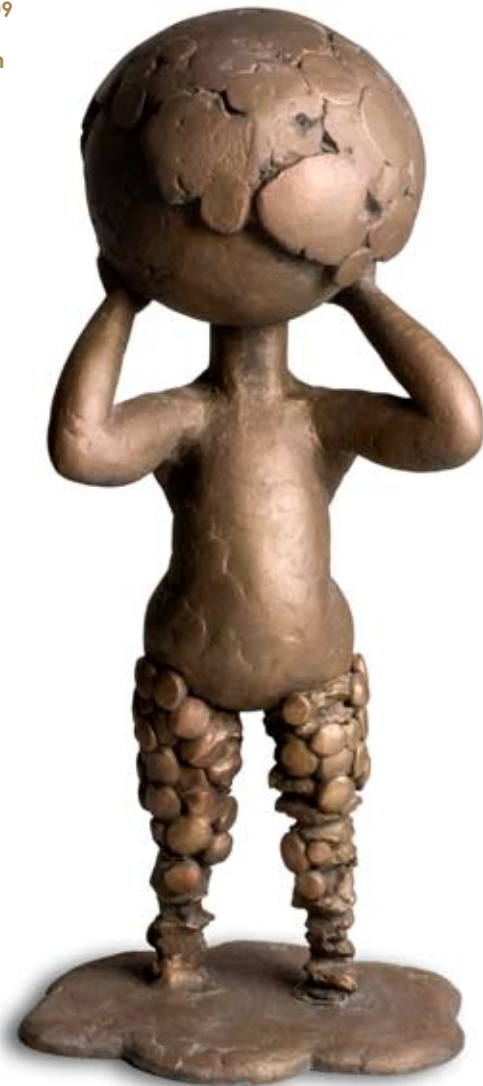
PALLOPÄÄ, 2009 pronssi 90 x 40 x 57 cm

“Työhuone edustaa hiljaisuutta, hiljaista ajattelua, hiljaisuudessa oloa. Se on tila, jossa ei ole esteitä. Olen omien ajatusteni instrumentti” - Marjukka Korhonen