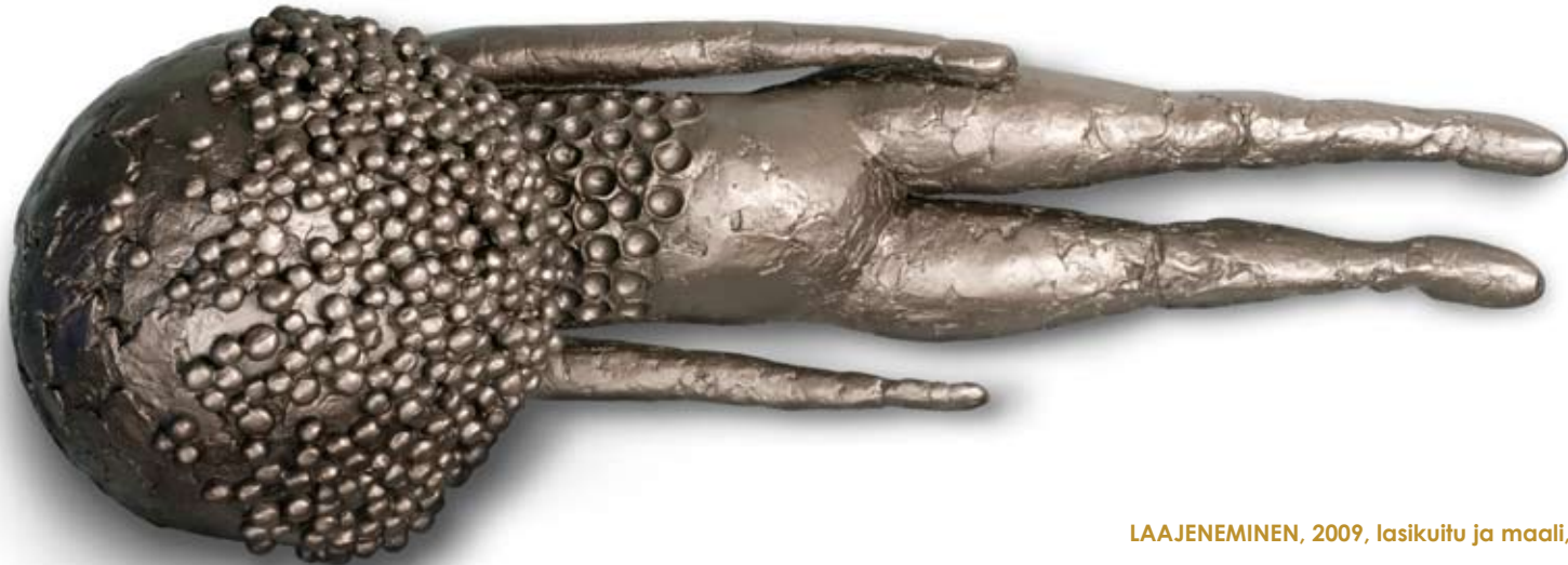
LAAJENEMINEN, 2009, lasikuitu ja maali, 44 x 122 x 55 cm

Kahdessa Pallopää-veistoksessa lapsen hahmo on tunnistettavissa